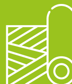
Productos en rollos