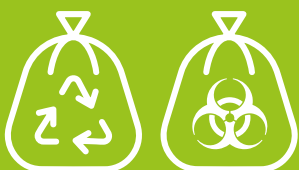
Bolsas para desechos